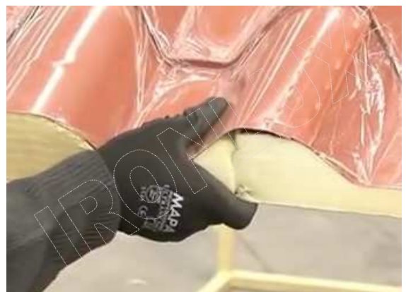
SITUAR EL SEGUNDO PANEL HASTA ASEGURARSE QUE ENCAJEN CORRECTAMENTE LAS TEJAS.