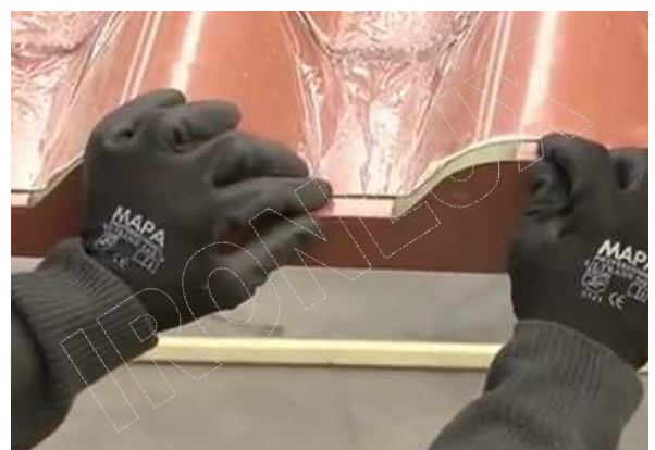
AJUSTAR LOS REMATES FRONTALES...