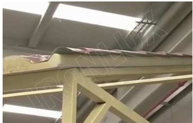
ALINEAR MUY BIEN EL PRIMER PANEL CON LA ESTRUCTURA